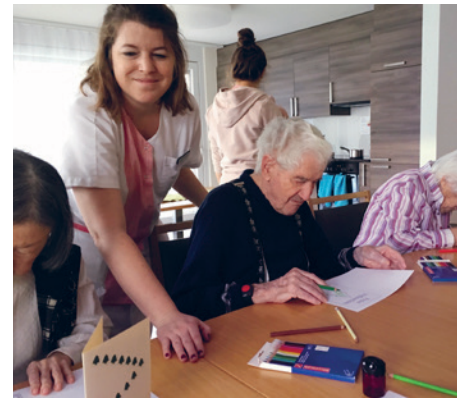
Oase am Rhein: kreatives Gestalten in der Adventszeit