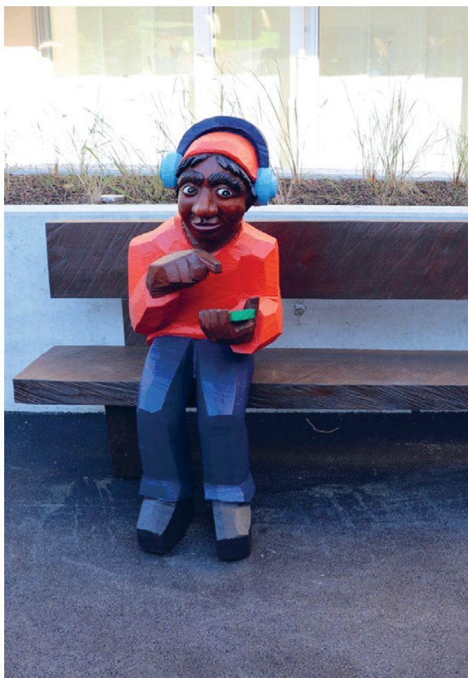
Aussenbank in der Oase Oetwil am See