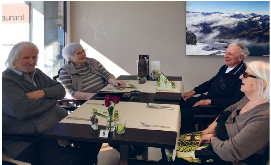
Oase Wetzikon: die ersten Senioren sind eingezogen