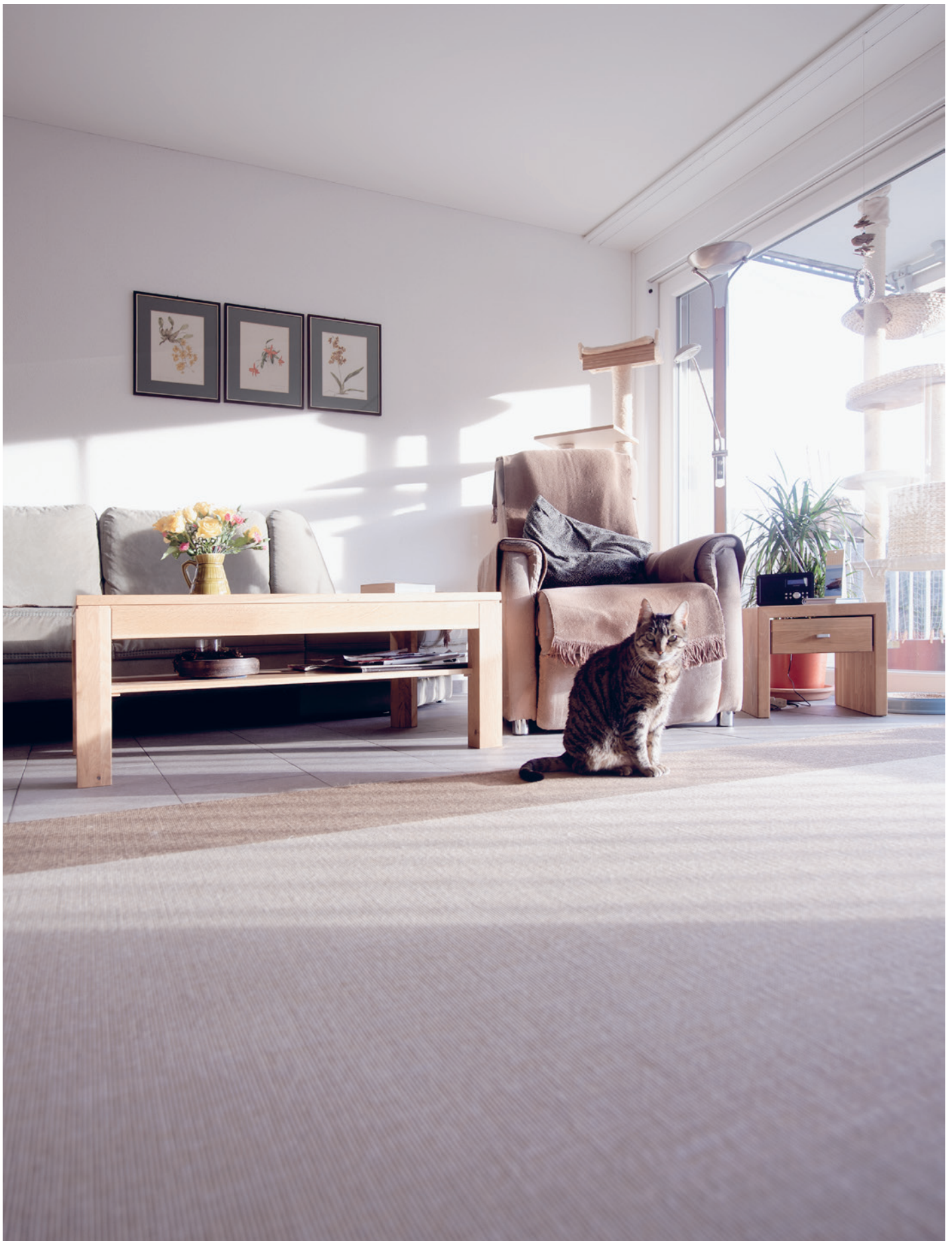
Seniorenwohnung in der Oase am Rhein / Titelbild: Skulptur von Stephan Schmidlin in der Oase Rümlang