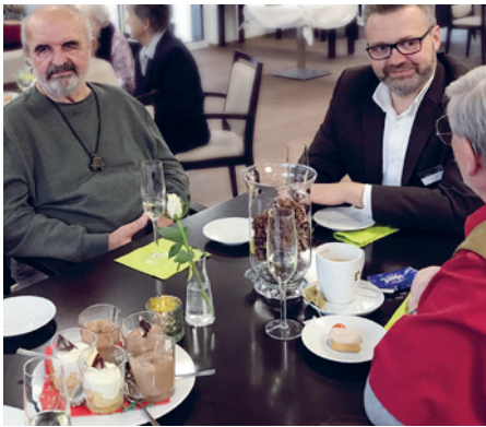
Oase EPPnetikon: auPs neue Jahr anstossen