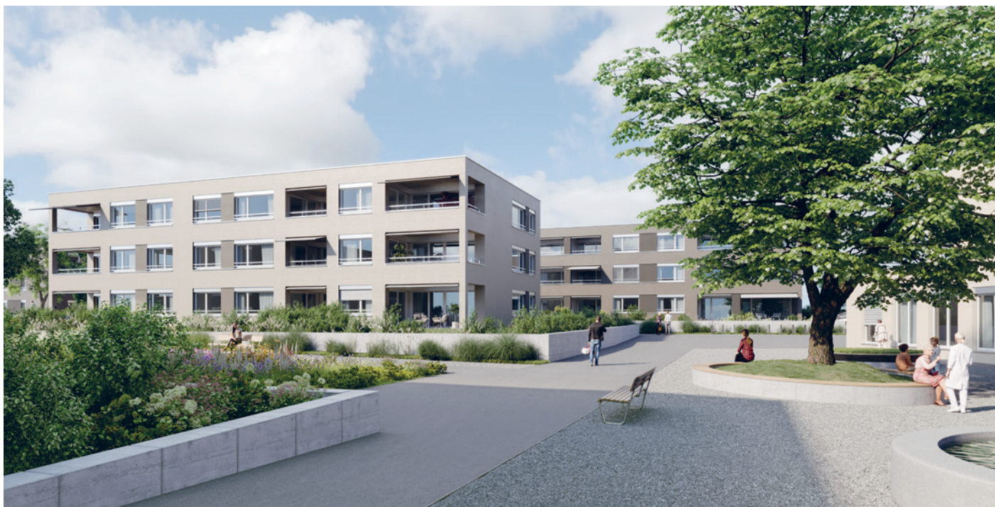
Visualisierung der Wohnsiedlung Momento in Obergösgen

Leben Sie in Ihrem eigenen gemütlichen Zuhause und lassen Sie sich Ihren Alltag nach Bedarf erleichtern. Damit Sie jeden Augenblick Ihrer Freizeit geniessen können.