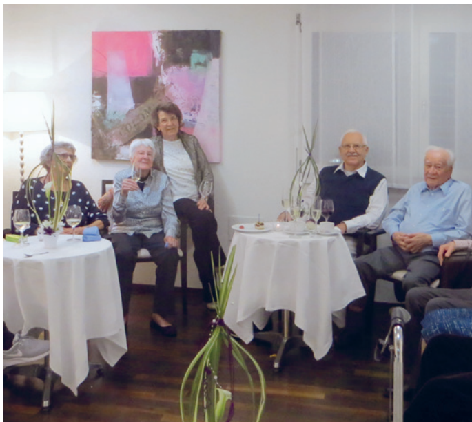
Oase Rümlang: 5-Jahre-Feier