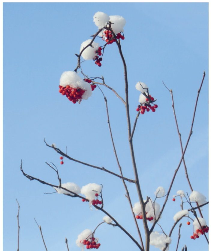
Oase Rümlang: Winterzauber