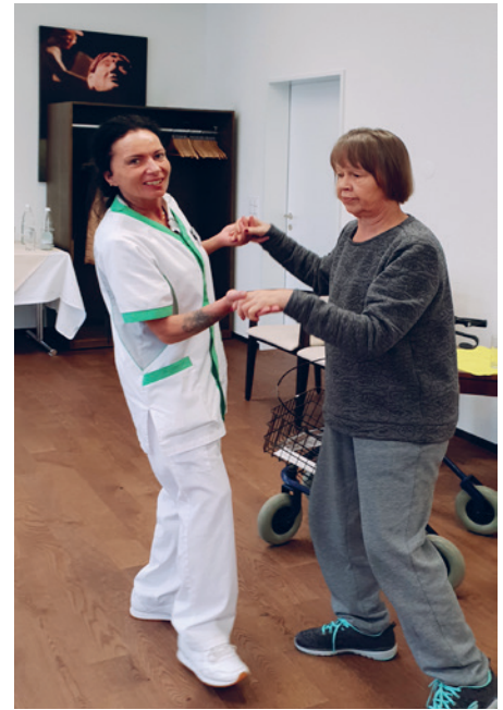
Oase Oetwil am See: Tanzen belebt Körper und Geist