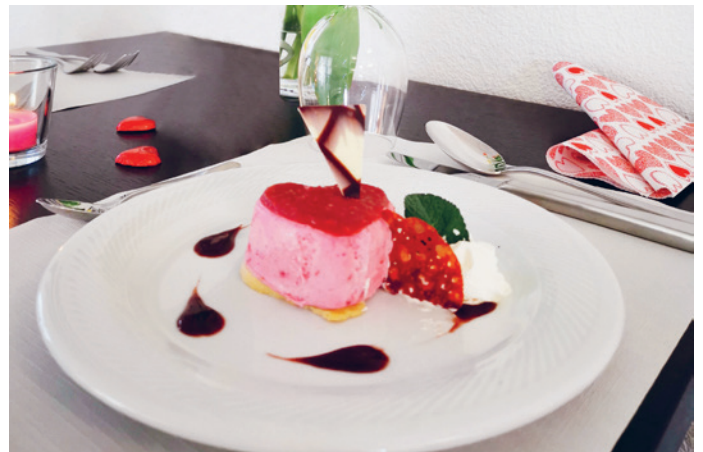
Oase Rümlang: Dessert zum Valentinstag