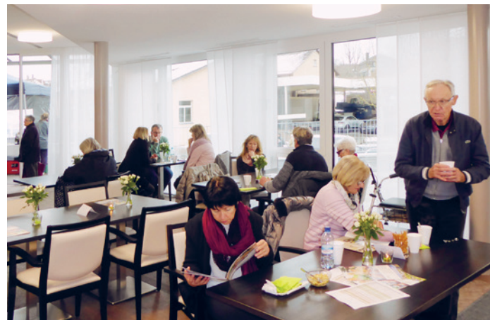
Impressionen vom Tag der offenen Tür

speist. Das Küchenteam und die Helfer am Grill haben sich so richtig ins Zeug gelegt. Zeitweise war es in der Oase so voll, dass man sich regelrecht von A nach B kämpfen musste – rund 800 Besucher besichtigten an diesem Samstag die Oase. Wir waren vom riesigen Interesse überwältigt und gaben unser Bestes, alle Fragen und Anliegen zu beantworten.