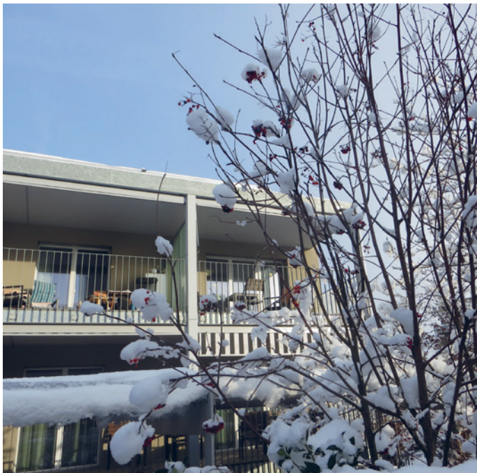
Oase Rümlang: der erste Schnee