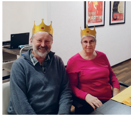
Oase am Rhein: Für einen Tag Königin und König sein