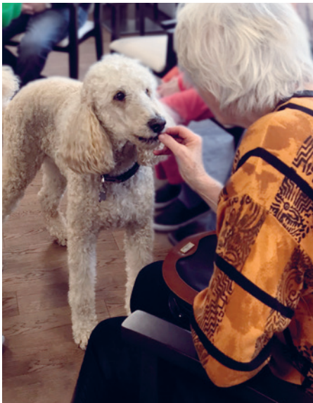
Oase EPPnetikon: Therapiehund